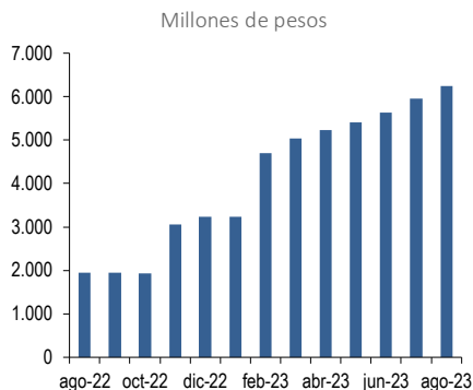
Gráfico elaborado por Feller Rate en base a información provista voluntariamente por la Administradora.